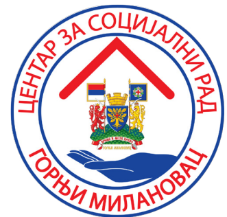
Centar za socijalni rad Gornji Milanovac - logo