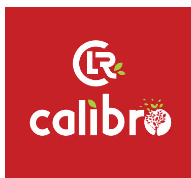
Calibro - logo